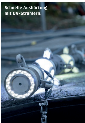
Schnelle Aushärtung mit UV-Strahlern.